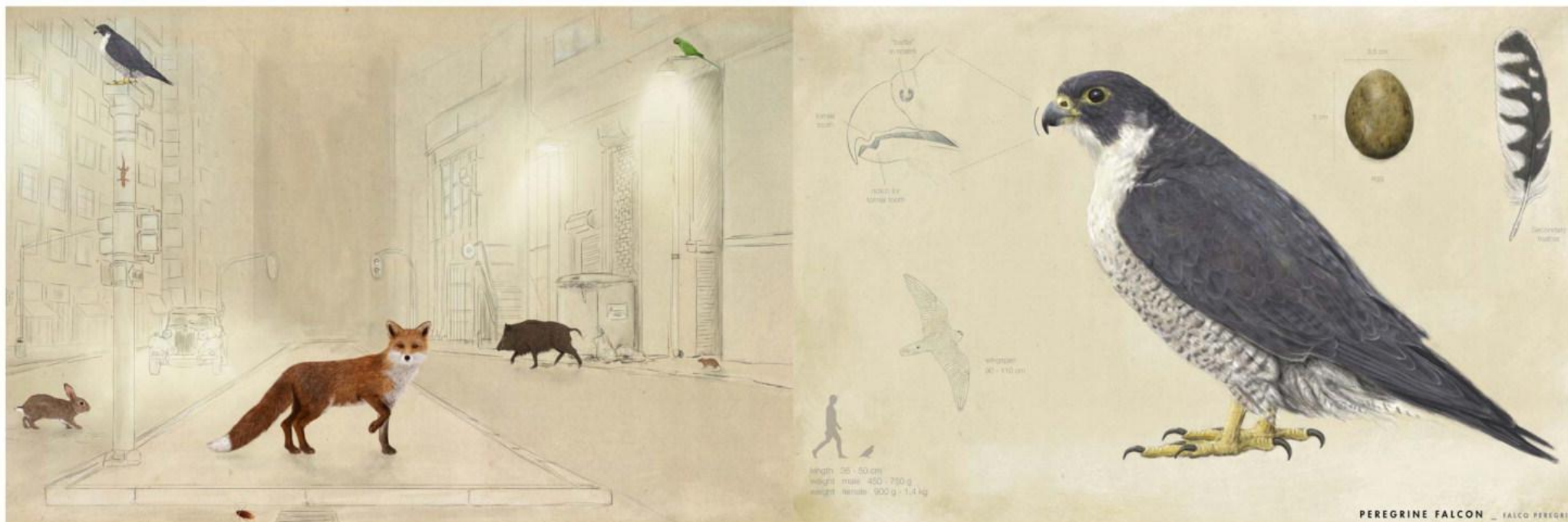
Zelfs vossen worden in de stad gesignaleerd.